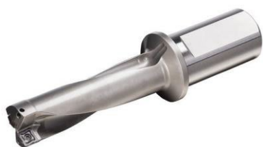
TOP CUT 4™

Du 22 mars au 30 juin 2026, profitez d'offres spéciales sur les meilleures solutions d'outillage WIDIA :